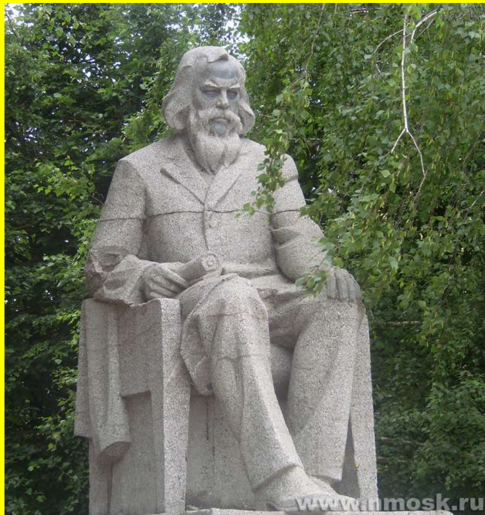
Памятник Д.И. Менделеев на ул. Дружбы (у "нового" корпуса РХТУ)