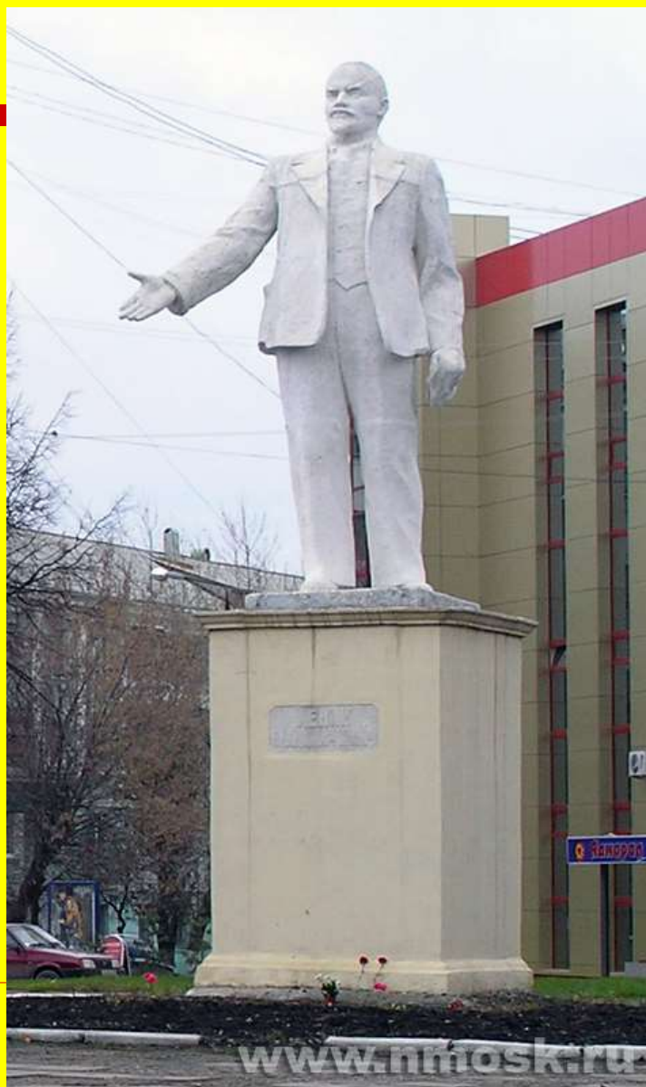
Памятник В.И. Ленину на пересечении ул. Московской-Комсомольской