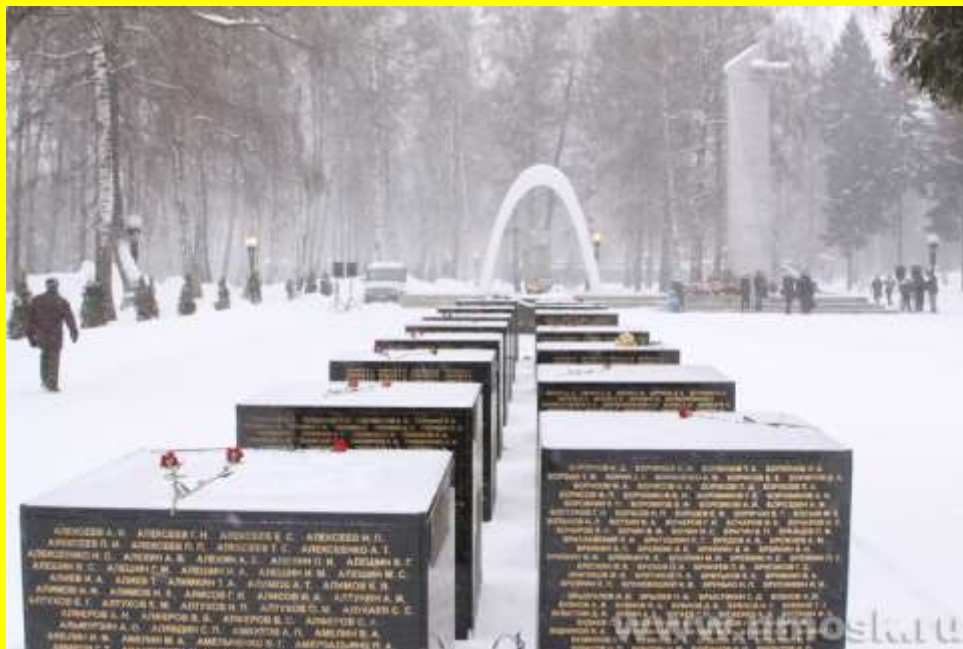
Мемориальный комплекс в Урвановском лесу