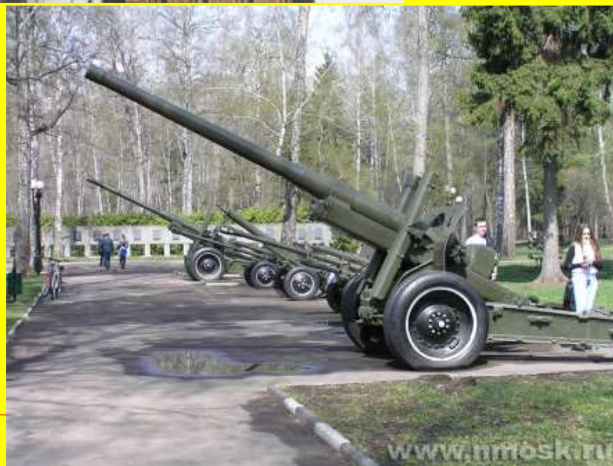
Пушки в Урвановском лесу