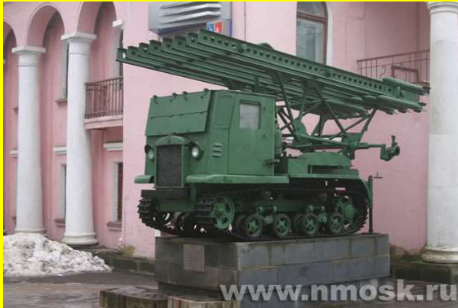
"Катюша" около музея города