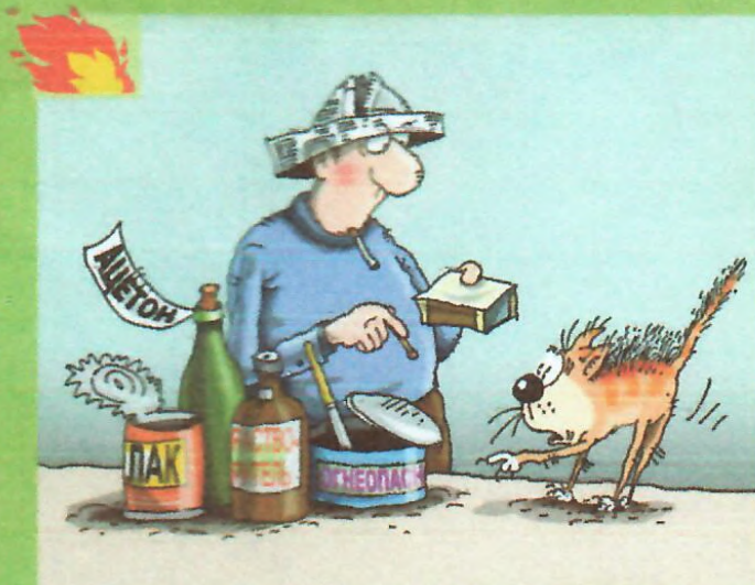
НЕОСТОРОЖНОЕ ОБРАЩЕНИЕ С ОГНЕМ