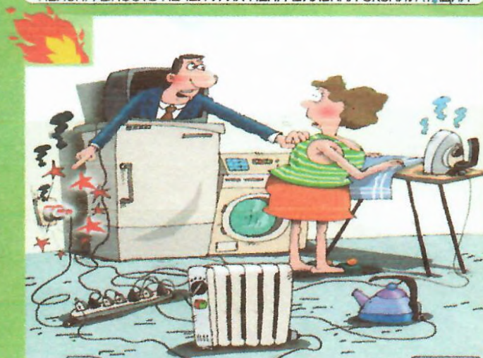
НАРУШЕНИЕ ПРАВИЛ ПОЖАРНОЙ БЕЗОПАСНОСТИ ПРИ ЭКСПЛУАТАЦИИ ГАЗОВОГО И ЭЛЕКТРИЧЕСКОГО ОБОРУДОВАНИЯ