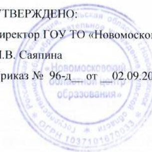
График проведения оценочных работ в 2024-25 учебном году